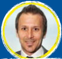
GAIZKA MENDIETA EX FUTBOLISTA INTERNACIONAL "LA EXPERIENCIA"

¡Animad a vuestros alumnos a apuntarse y participar. Será divertido y podrán conseguir fantásticos premios!